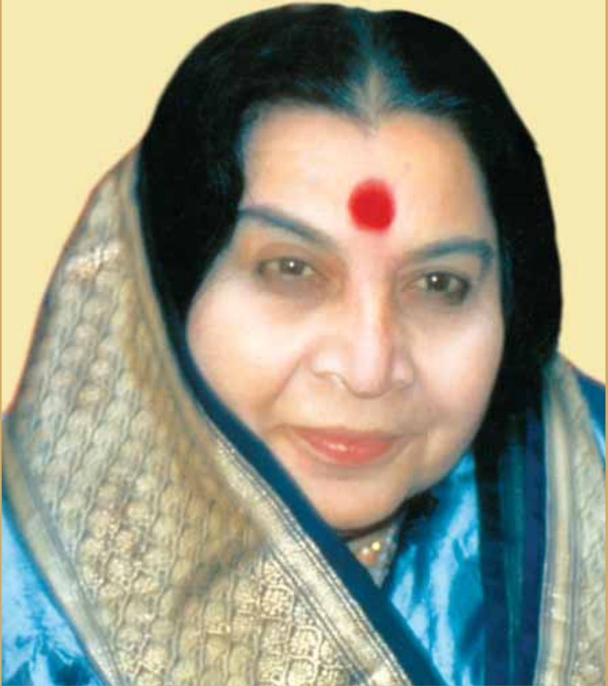
माताजी श्री निर्मला देवी