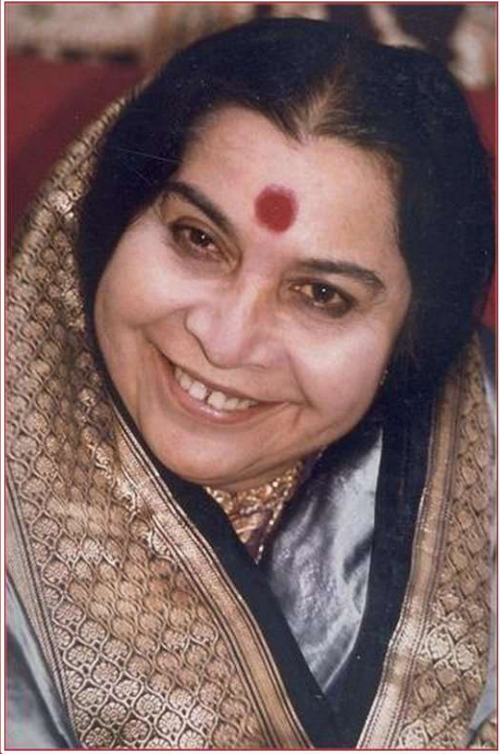
SHRI MATAJI NIRMALA DEVI