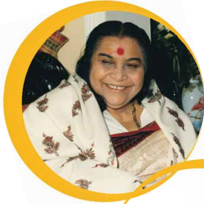
कुंडलिनी आणि शिवशक्ती - ४