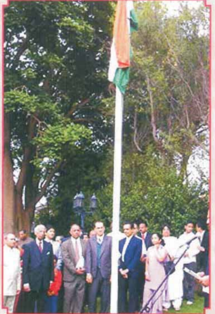
भारतीय प्रजासत्ताक दिन व ऑस्ट्रेलिया दिन , बर्वुड