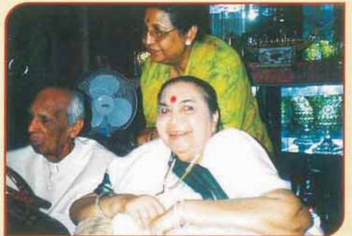
प्रतिष्ठान पूजा, पुणे दिनांक १२, नोव्हेंबर २००५