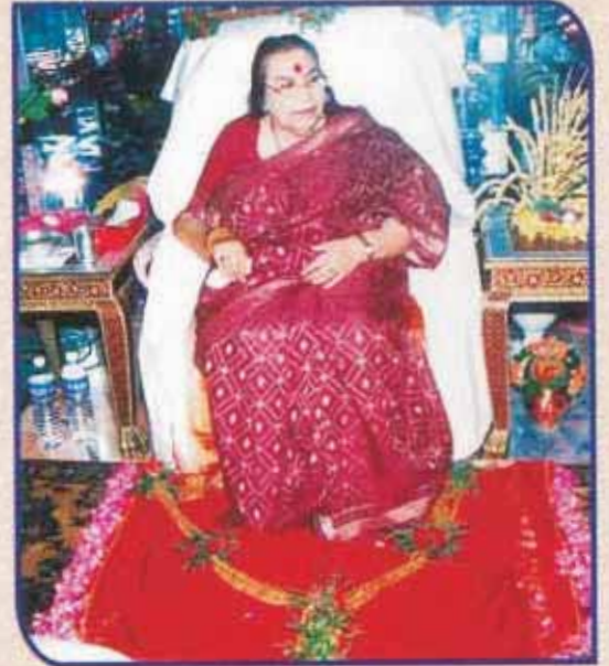
संक्रांत पूजा, १९ जानेवारी २००४