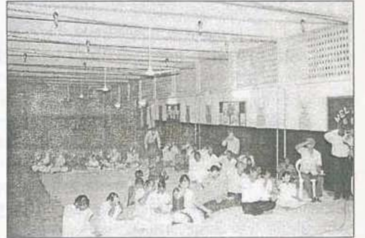
१५ ऑगस्ट २००९ रोजी विद्याकुंज विद्यालय वारजे पब्लिक प्रोग्रॅम

सहज सहज सव कोड कहे, सहज न चीन्हे कोय । जो सहजै साहेब मिल्लै, सहज कहावै सोय ॥