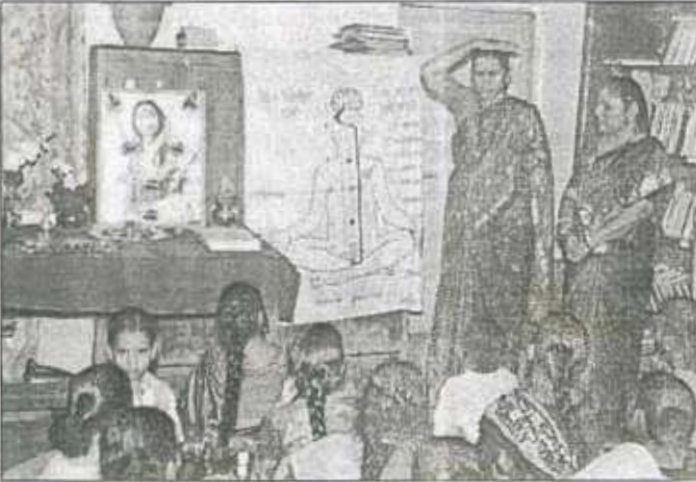
१९ ऑगस्ट २००९ जुन्नर सेंटर हळदी-कुंकू निमित्त जागृतीचा कार्यक्रम