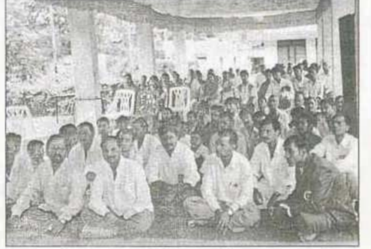
२५ ऑगस्ट २००९ गणेशोत्सवामध्ये कानकास्ट प्रा. लि. चिंचवड पुणे गणपतीसमोर पब्लिक प्रोग्रॅम झाला

क्षेत्रातील व्यावसायिकांना, तंत्रज्ञांना सहजयोग समजावून सहजयोगात आणल्यास मानवजातीचे कल्याण होईल व अशा आपत्तींवर मात करता येईल.