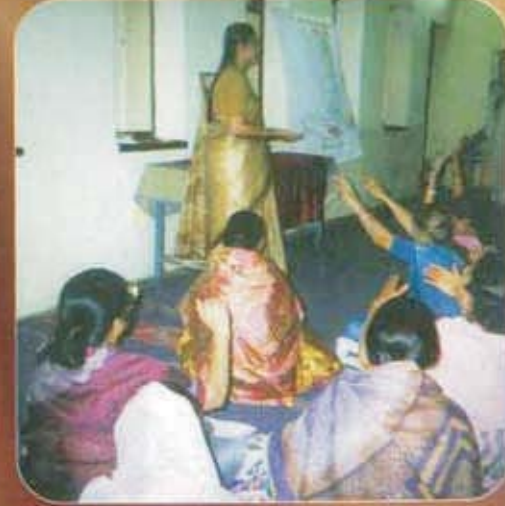
पुणे शहरातील वाल्मीराम रोड जवळील शमोस भंगाल कार्यालयात झालेला पब्लिक प्रोग्रॅम