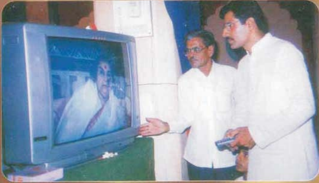
पुणे सहजयोग केंद्रासाठी पोतलेल्या टी. व्ही. व व्ही. सी. डी. चे उद्घाटन करताना