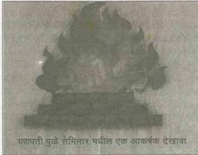
गणपती पुळें सेमितार मधील एक आकर्षक देखावा

काही मुलं सडसडीत अंगाची असतात. त्यांचे स्नायू विकसित झाले नसतात. स्नायूंचा विकास होण्यासाठी मसाजसारखं दुसरं काहीच नाही. चांगलं मालिश करा आणि अँडिक्सिलीन द्या. चांगलं मॉलिश तूपाने होतं. तूप डोक्यावर घालता नये. त्यासाठी खोबरेल तेल चांगलं, कारण त्यात "अ" जीवनसत्व असतं. मुलं खूप आरोग्यी पाहिजे. त्यांना नीट करण्यासाठी व्हायब्रेशन्स द्या.