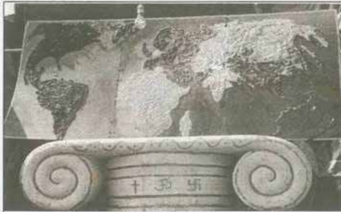
गणपतीपुळे सेमिनार मधील एक आकर्षक देखावा

पाच वर्षांपर्यंत तुमच्या मुलांना ती चांगली नसल्यास मार देऊ शकता. जर ती वात्रट असतील तर तुम्ही त्यांना खोलीत नेऊन एकदा सांगितलं पाहिजे की तुम्ही नीट वागला नाही तर आम्ही तुम्हाला मार देऊ. त्यांना वेगळे सांगा. इतरांच्या समोर नको आणि ओरडू नका. मुलांना कधीही इतरांसमोर सुधारू नये. त्याला खोलीत न्या आणि सांगा. "आता बघ, आम्ही माताजींना भेटायला जात आहोत. श्रीमाताजी देवी आहेत. तुला त्याप्रमाणे वागले पाहिजे. आपण त्यांच्या घरी जाणार आहोत. आणि तुम्ही काहीही विचारता कामा नये. तुम्हाला गप्प बसलं पाहिजे आणि नीट वागलं पाहिजे."