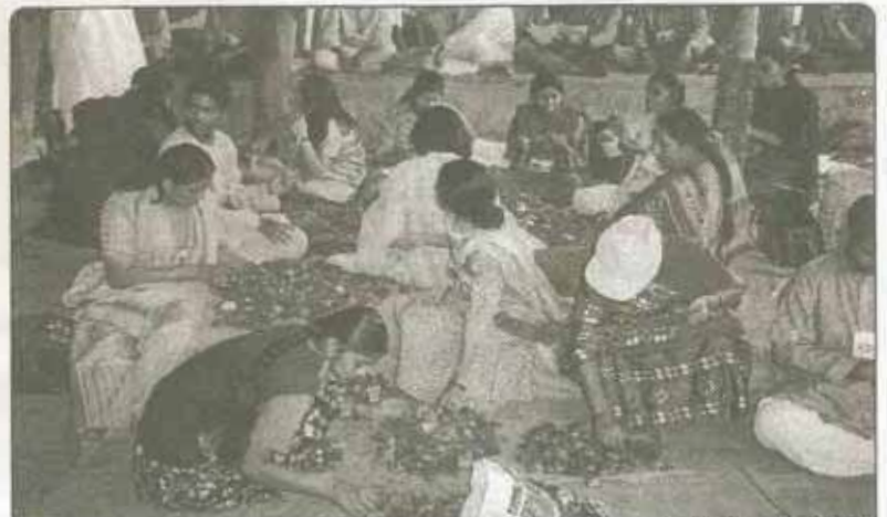
गणपतीपुळे सेमिनार मधील रोजचे स्टेज वरील फुलांच्या सजावटीचे काम करताना