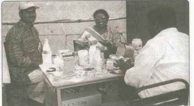
गणपतीपुळे सेमिनार मधील सहजयोग्यांसाठी मोफत वैद्यकीय सुविधांचा स्टॉल