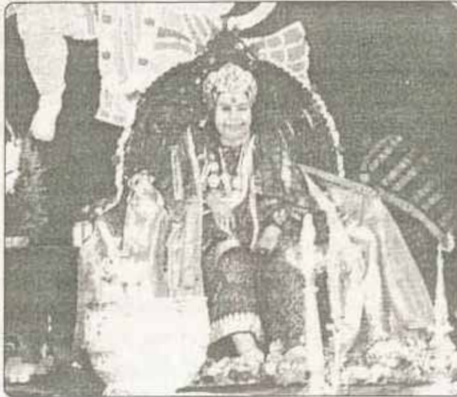
हनुमान पूजा १९९९ (पुणे)

निर्मळ आहेतच पण त्याचबरोबर समझदार व युक्तिशाली आहेत, त्याचप्रमाणे शक्तिबरोबर त्यांच्याजवळ नीर-क्षीर विवेकही आहे हे महत्त्वाचे. ते बुद्धीमानही आहेत, लौकिक व्यवहारातील बुद्धि नाही तर प्रेमाचे अधिष्ठान असलेली बुद्धि, त्या प्रेमामधूनच त्यांना सर्व काही समजते. या विशेष बुद्धीचे स्वरूप श्रीगणेश व श्री हनुमानच दाखवून देतात. तसे पाहिले तर हनुमान फार चपळ, तेजस्वी आणि बलशाली तर श्रीगणेश शांत स्वभावाचे. पण वेळ आली की दोघेही खूप संहारक आहेत. म्हणून तुम्हाला स्वतःला दुष्टांचा संहार करण्याची जरूर नाही; कारण हे दोघेजण त्यासाठीच तुमच्यामागे सदैव लक्ष ठेऊन असतात. म्हणून तुम्हाला जे कोणी त्रास देणारे भेटतील त्यांच्यापासून हे दोघेही तुमचे रक्षण करणार आहेत हे ध्यानात ठेवा. मोठेमोठे पुढारी, मंत्री यांच्याबरोबर अंगरक्षकांचा ताफा असतो पण हे सतत तुमच्याबरोबरच राहतात. सहजयोग्यांची सुरक्षा-व्यवस्था त्यांच्याबरोबरच असते. याशिवाय तुमच्या सुरक्षा-व्यवस्थेमध्ये गणांचे कार्य महत्त्वाचे आहे; गणांचे कार्य श्रीगणेश नियंत्रित करतात म्हणूनच त्यांना 'गणपति' म्हणतात. तुमच्याबद्दलची सर्व माहिती, तुम्ही जे काही करता किंवा मनात आणता ती सर्व माहिती ह्या गणांकडून श्रीगणेशाकडे पोचवली जाते. कुठे काय गडबड चालली आहे, तुम्हाला कोण त्रास देत आहे, तुमच्या कार्यामध्ये कोण काय अडथळे व अडचणी आणत आहेत, तुमच्या नकळतही कोण तुमच्याविरोधी कार्य करत आहे हीहि सर्व माहिती गणांकडून पोहचवली जाते आणि त्यानुसार या दोन्ही देवता तुमचा संभाळ सर्वकाळ करत असतात. श्रीगणेशांच्या आज्ञेनुसार श्री हनुमानही सज्ज राहतात. म्हणून सहजयोग्यांना कसल्याही बाबतीत भीती वाटण्याची जरूर नाही. नुकतीच घडलेली एक गोष्ट उदाहरण म्हणून सांगते. अमेरिका आजकाल