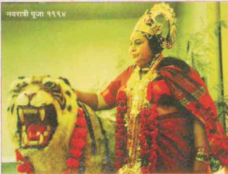
नवरात्री पूजा १९९४