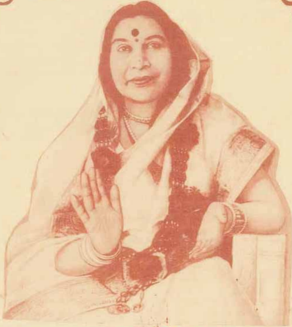
परमपूज्य माताजी श्री निर्मलादेवी